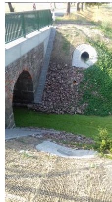
Bestand neu Brücke Bertkow