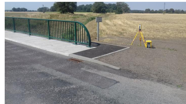
Bestand neu Brücke Hindenburg